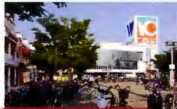
わくわくシティオークワ