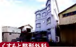
くすもと整形外科